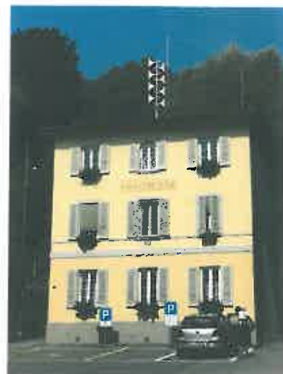
Muzzano, ore 13.10 (foto) e 16.30