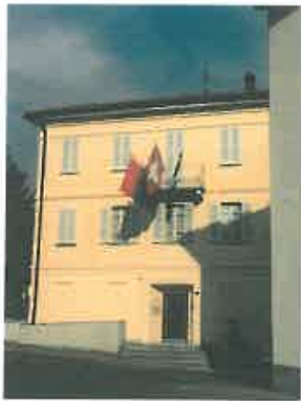
Collina d'Oro (Gentilino)